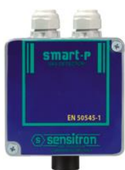
CO or NO 2