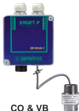
CO & VB