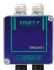
CO & NO 2